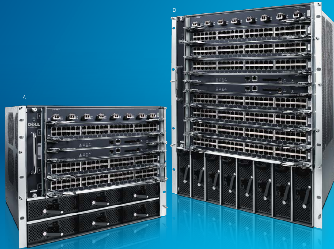
A. 9RU Dell Networking C-Series C7004/C150 B. 13RU Dell Networking C-Series C7008/C300

Switches 1GbE y 10GbE económicos y con eficiencia energética, diseñados para modernizar y ampliar la infraestructura de red. Equipados con las características que necesita para conseguir un mejor coste total de propiedad. Los switches serie N utilizan un completo conjunto de características de nivel 2 o 3 de clase empresarial, posibilitan una gestión uniforme y simplificada, y ofrecen un diseño de redes y dispositivos de alta disponibilidad.