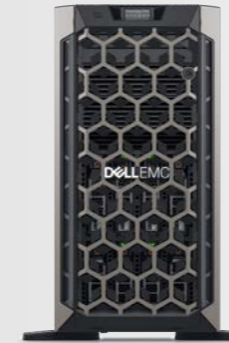
PowerEdge T440 Código de pedido: pet4402a