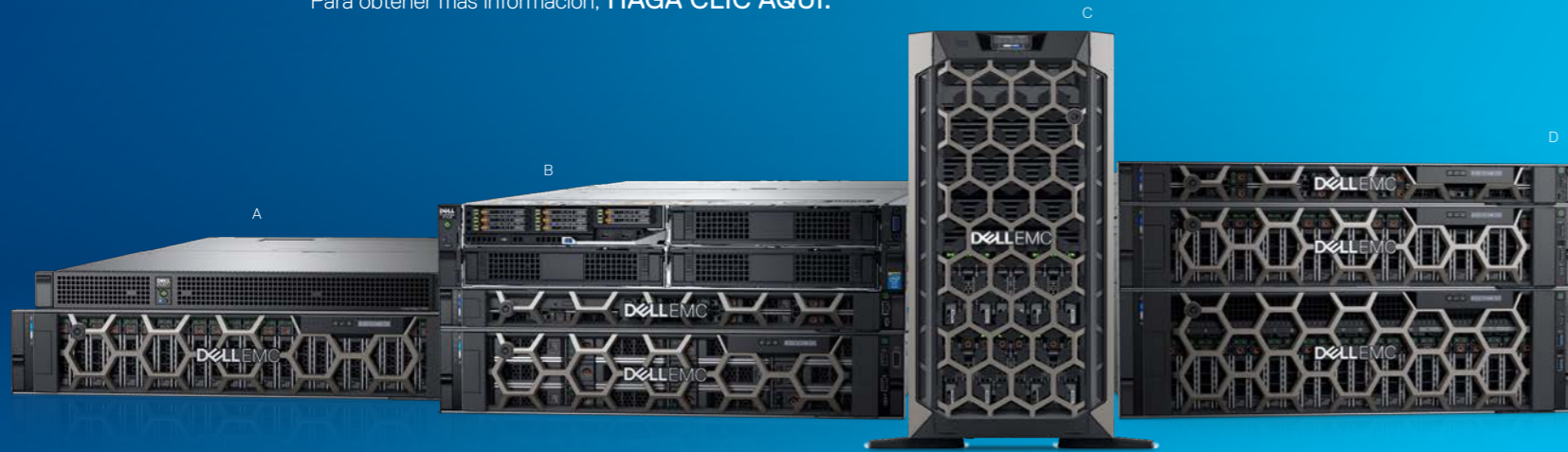
A. C4140, PowerEdge R740XD B. Chasis de servidor FX2s, PowerEdge R440, PowerEdge R540 C. Servidor en torre PowerEdge T640 D. PowerEdge R640, R740, R940

Para obtener más información, HAGA CLIC AQUÍ.