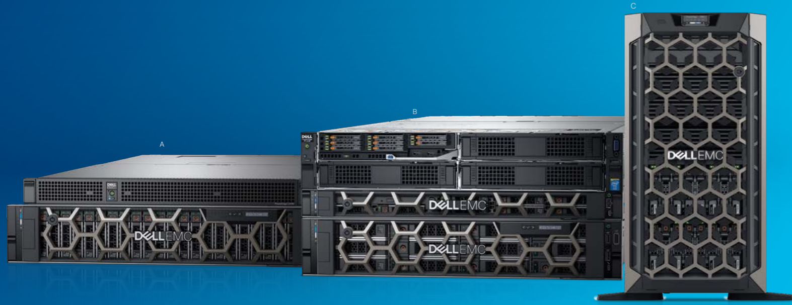
A. C4140, PowerEdge R740XD B. Chasis de servidor FX2s, PowerEdge R440, PowerEdge R540 C. Servidor de torre PowerEdge T640

Actualice los servidores anticuados por la 14.ª generación de servidores Dell EMC PowerEdge. Con capacidad de ampliación, automatización inteligente y seguridad integrada, la última generación de servidores PowerEdge sienta las bases de la transformación de la tecnología informática. Dell puede ayudarle a elegir el servidor adecuado y las soluciones idóneas para cubrir las necesidades de las cargas de trabajo y de sus proyectos.