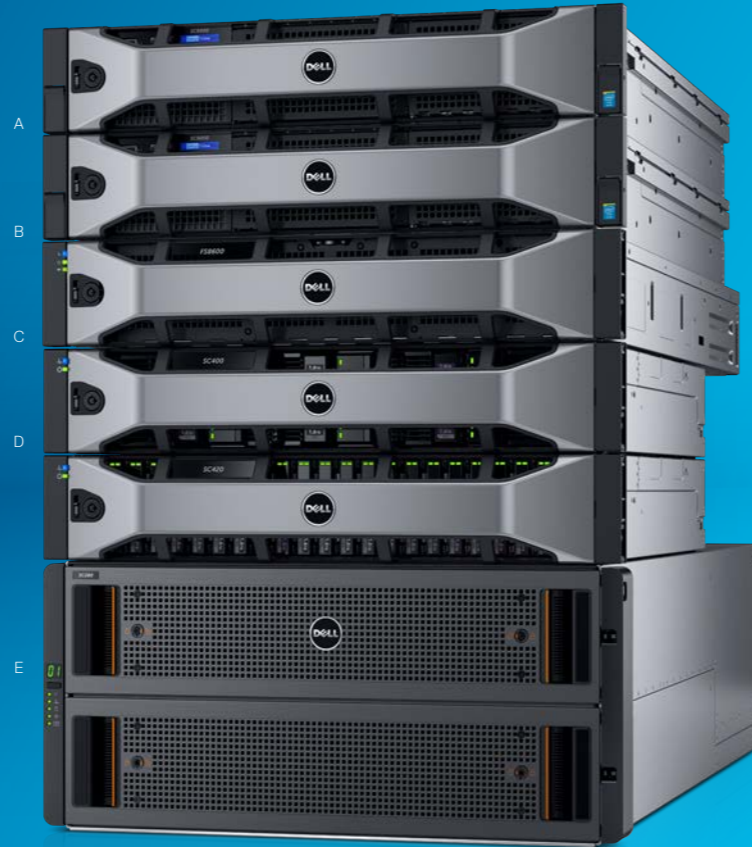
A. SC9000 B. FS8600 C. SC400 D. SC420 E. SC280 SC9000

Flexible, con una alta capacidad de almacenaje para cargas de trabajo exigentes, ideal para aplicaciones y cargas de trabajo virtuales en las que la capacidad, el rendimiento, el ahorro de espacio y la eficiencia de costes son importantes por igual.